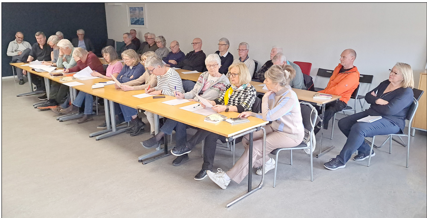
Årsmötesdeltagare i Röda Rummet.