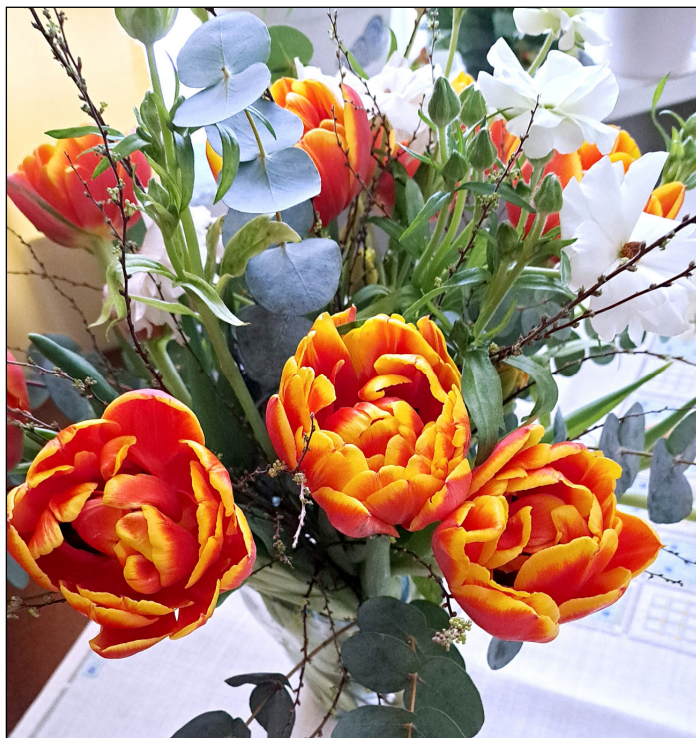
Inblick i min avtackningsbukett som jag fick efter 15 år som hemsidesredaktör. /Arne